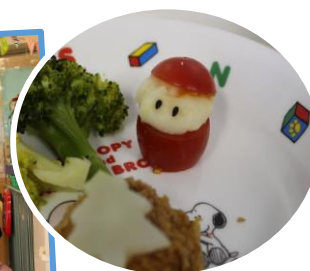
← 給食にも かわいい サンタさん がひょっこり。